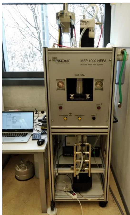
Obr. 2: Testovací zařízení MFP 1000 HEPA